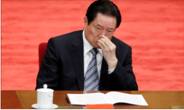
Zhou Yongkang blev dømt for korruption i 2015. Han var tidligere sikkerhedschef, medlem af politbureauets stående udvalg og nummer tre i partihierarkiet.