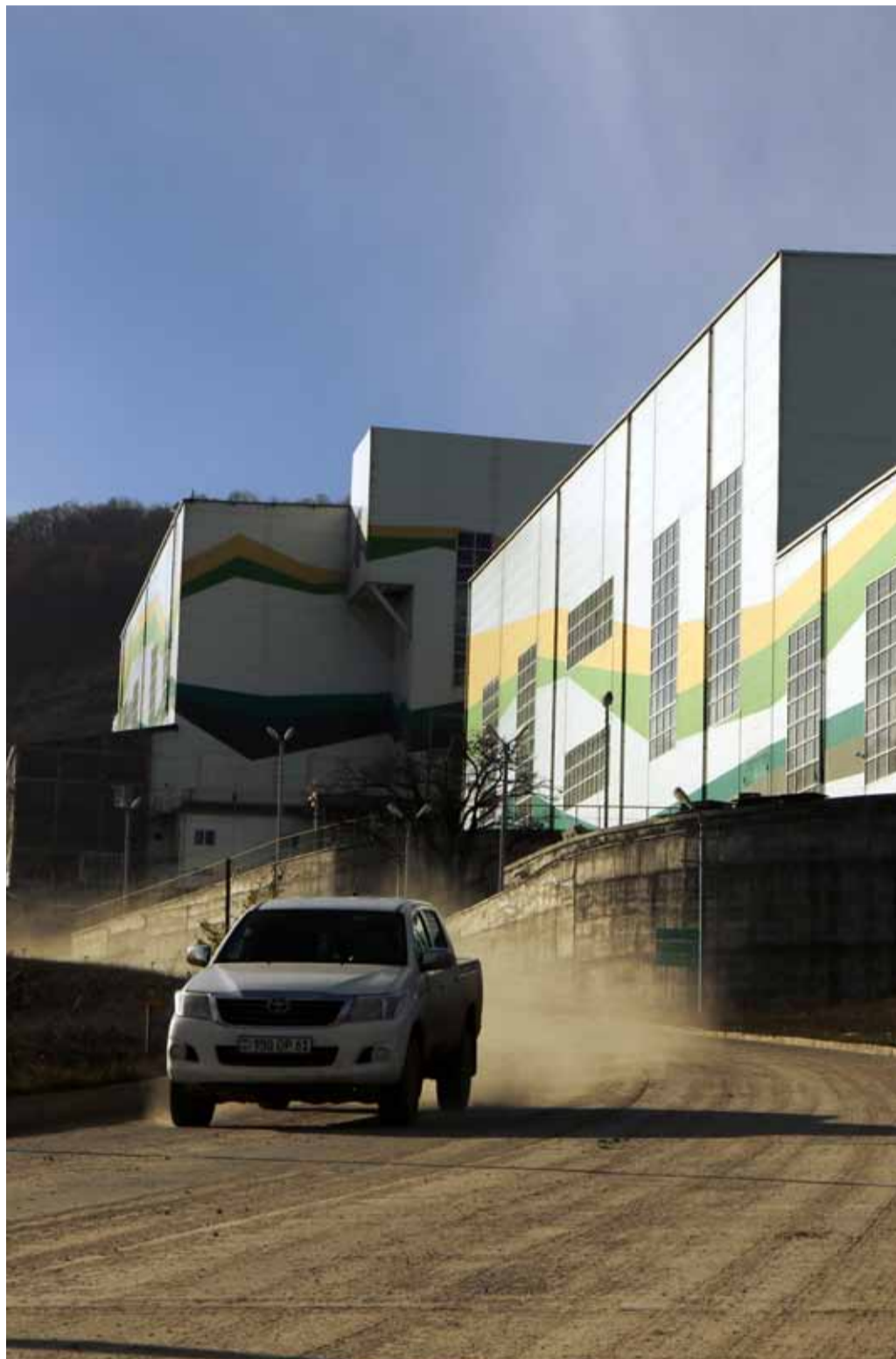
Fabriksbygningerne, som FLSmidth opførte i mineområdet i Teghut. Faciliteterne blev taget i brug i 2014. Pension Danmark har stillet 350 millioner kroner til rådighed for Vallex Group via et lån i en russisk bank. EKF Danmarks Eksportkredit garanterer at pensionskassen får pengene retur.