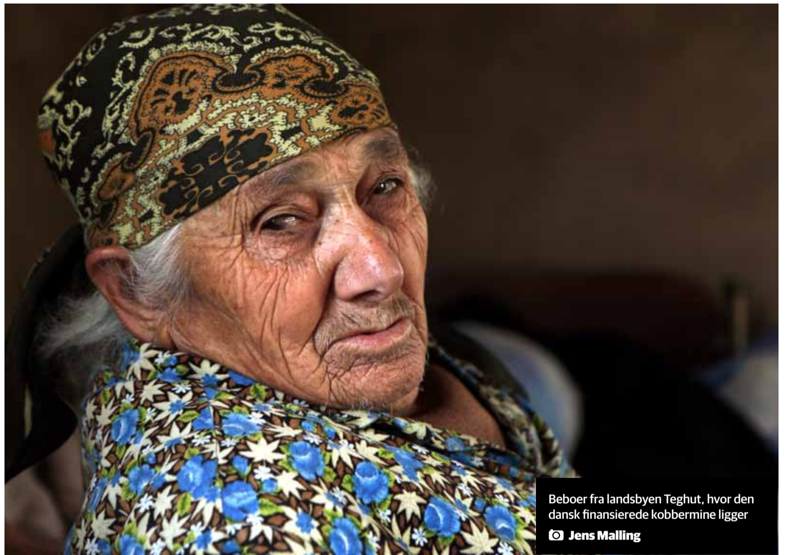
Beboer fra landsbyen Teghut, hvor den dansk finansierede kobbermine ligger

– Når vi går ind i et projekt for at hjælpe danske virksomheder med eksport, så skal det gøres på en ansvarlig måde. Der er nogle regler, der siger, at vi skal anvende internationale standarder for miljø og social bæredygtighed. Det stiller vi som krav. Og det er det, vi følger op på. I forhold til de lokale i Armenien, så er vi af den holdning, at det er bedre, at vi er med og holder fast i de her krav, end hvis vi ikke var med. For mineprojektet kører under alle omstændigheder. Så der kan EKF være med til at sørge for, at projektet skal op-