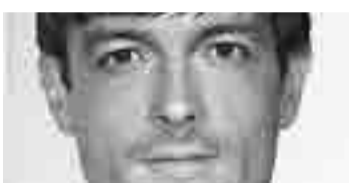
Kiev

De naivistiske maleriene til Marija Prymatsjenko kan gi oss innblikk i kreftene som nå river Ukraina fra hverandre.