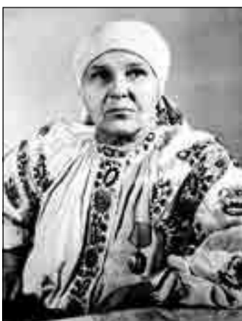
FOLKEKJÆR: Den ukrainske maleren Marija Prymatsjenko.

Marija Prymatsjenko levde fra 1909 til 1997 og har fått status som Ukrainas mest berømte billedkunstner. Pablo Picasso var en av dem som lovpriste verkene hennes un-