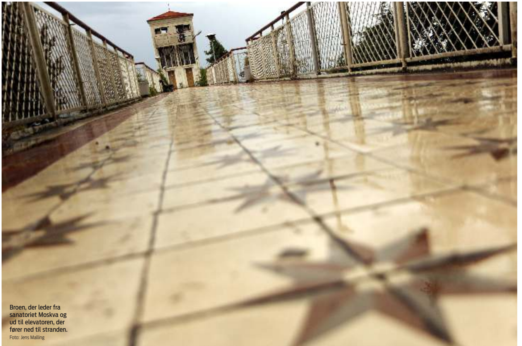
Broen, der leder fra sanatoriet Moskva og ud til elevatoren, der fører ned til stranden.