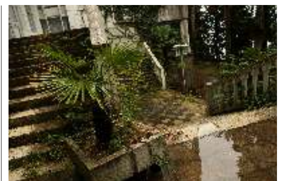
Parken til sanatoriet Moskva.

Luften står stille. Der lugter mørkt mellem bogreolerne, og støvet ligger i et fint lag hen over titlerne. "Kommunistisk teori", "Klassekamp", "Dia-