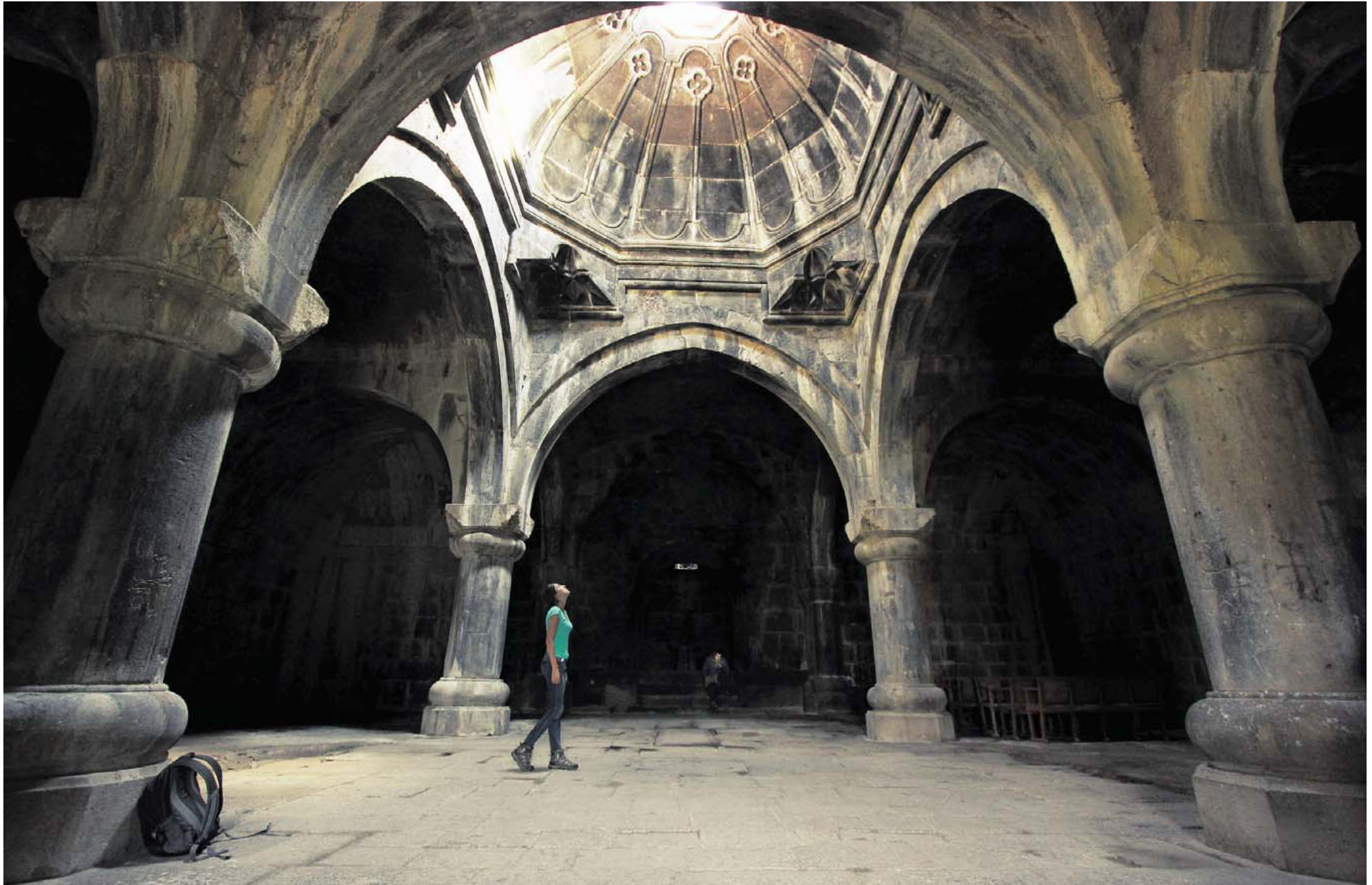
FORHISTORISK. At træde ind under de dunkle buegange bidrager til fornemmelsen at være en arkæolog, der opdager efterladenskaberne fra en svunden civilisation.

verdenskulturarv. Bygningsværkerne repræsenterer det fornemmeste af armensk religiøs arkitektur. Alligevel er attraktionerne stadig noget undervurderede.