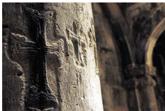
TEGN. Halvt udviskede kors og mystiske symboler træder frem på de grove mure.