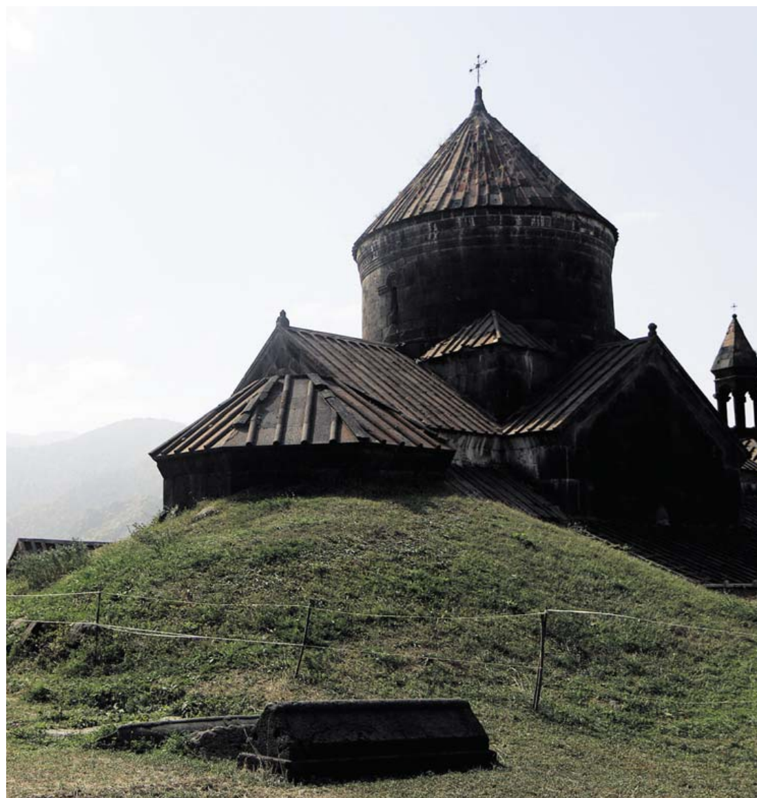
FORSVAR. Ofte var det gejstlige byggeri også forsvarsværker. Derfor ligger gudshusene utilgængeligt på tinderne over Debed-dalen. Udsigten er fin, så fjender kunne spottes på lang afstand.

I det samme kommer endnu en af Alaverdis seværdigheder til syne foruden: en næsten 20 meter lang stenbro over Debed-floden – den har forbundet hver bred i mere end 800 år og er stadig i brug. Svævebanen er en attraktion i sig selv og er samtidig den nemmeste og smukkeste måde at komme op til Sa-