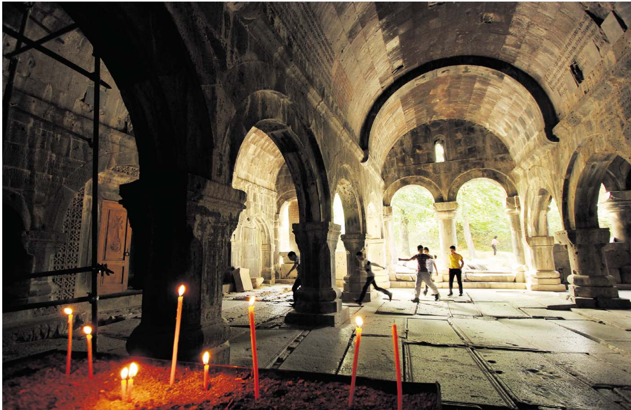
ALSIDIGE. Klostrene var centre for uddannelse, videnskab, kunst og filosofi. De blev opført af herskerne af det armenske kongedømme Lori, da riget var særlig fremgangsrigt.

stribet, og fabrikkerne står tomme. Turister og lokale har dog stadig glæde af de sovjetiske myndigheders bestræbelser på nemt at bringe arbejdere fra boligkvarteret oppe på plateauet og ned til fabrikkerne ved flodbredden.