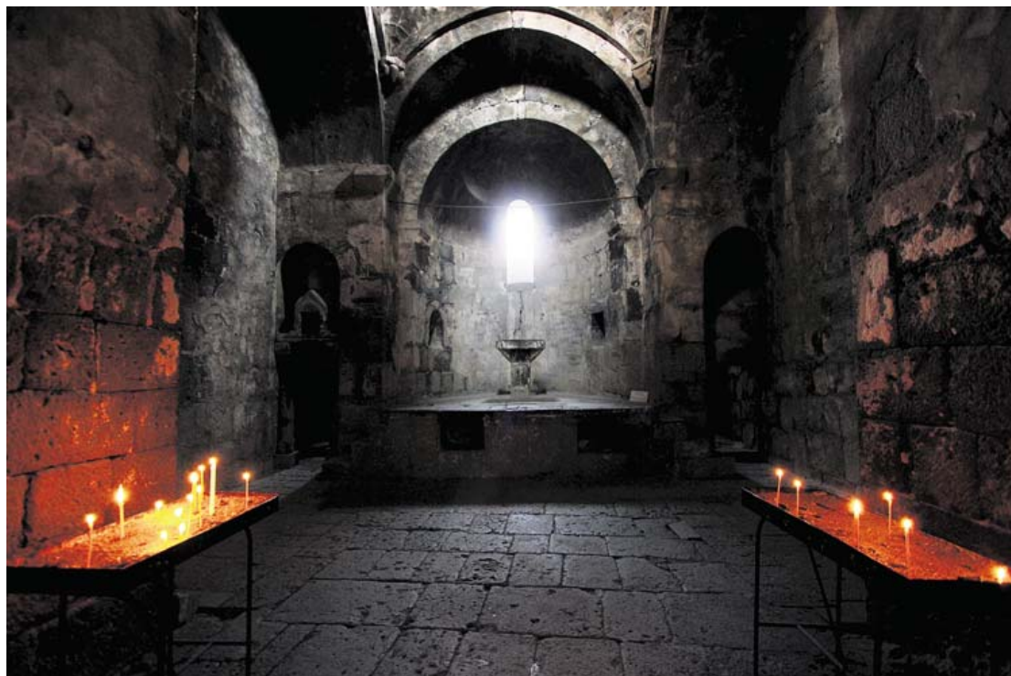
LYS. Klostrene gemmer på et væld af hemmelige skakter og halvskjulte kapeller.

Denne storhedstid står i dramatisk kontrast til det forfald, der nu hænger Alaverdi. Klostrene flankeres af andre og meget nyere ruiner. Postsovjetisk nedgang satte ind i den stolte indu- ▶