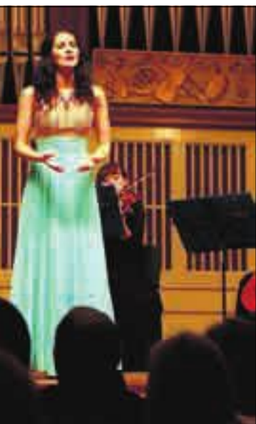
Schuberts «Ave Maria»,