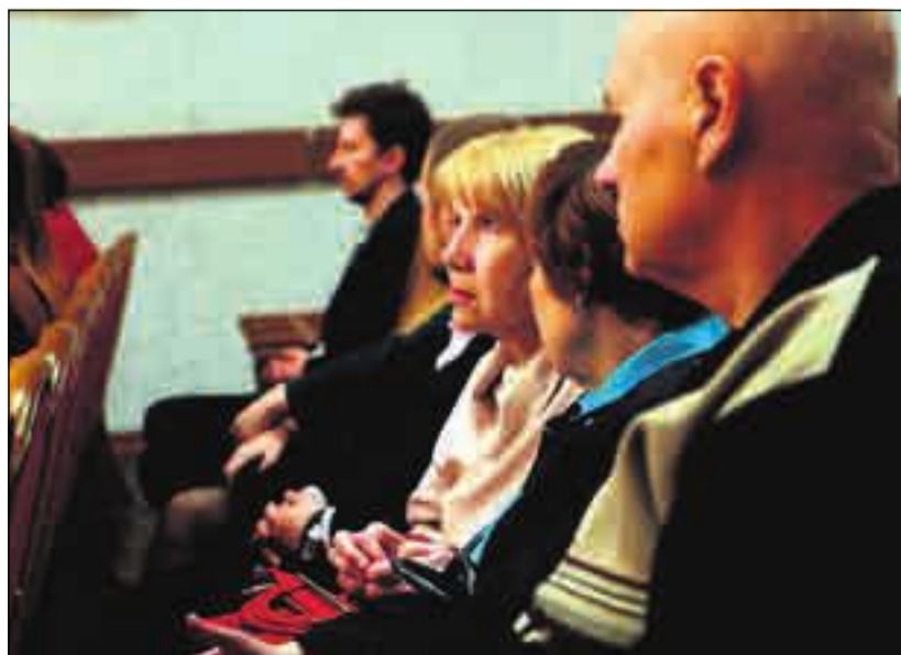
PUBLIKUM: Konsertsalen i Donetsk er nesten helt full.