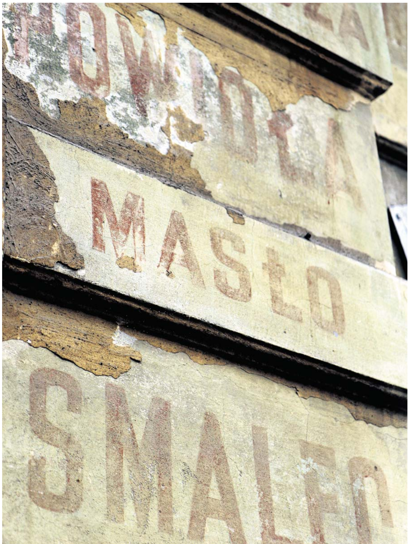
POLSK. Under flere lag mørtel kommer falmede bogstaver fra en butiksfacade pludselig til syne.