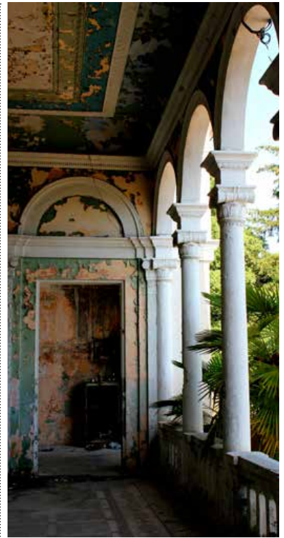
FORFALD, MEN PÅ DEN CHARMERENDE MÅDE.

et flertal af EU-landene, heriblandt Danmark, officielt godkendte Kosovos selvstændighed fra Serbien i februar 2008. Senere samme år rasede vestlige ledere over Ruslands beslutning om at anerkende Abkhasien og Syd-ossetien. De kaldte det blandt andet “fuldstændig uacceptabelt” og “et brud på international lov”.