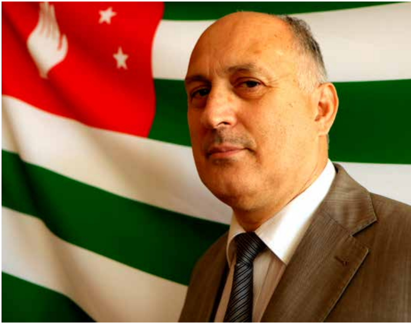
“ALLE DØRE ER LUKKET FOR OS”, SIGER ABKHASIENS UDENRIGSMINISTER VJATJESLAV TJIRIKBA.