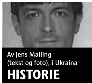
Av Jens Malling (tekst og foto), i Ukraina

Mosaikker, minnesmerker og annen kunst som hyller sovjettida skal fjernes og ødelegges. Det krever en ny antikommunist-lov i Ukraina.