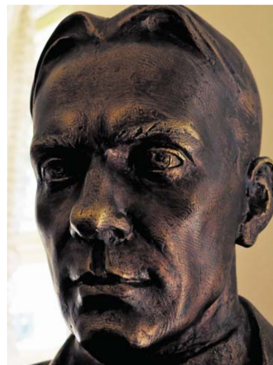
På Bulgakov-museet kan man se en skulptur, der afbilder den berømte forfatter.