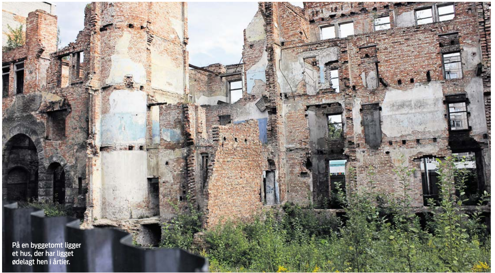
På en byggetomt ligger et hus, der har ligget ødelagt hen i årtier.

Efter tre års nazistisk rædselsherskab i det vestlige Sovjetunionen frygtede civilbefolkningen i Königsberg og Østpreussen med rette den Røde Hærs komme, nu hvor krigslykken var vendt. Længe var det dog ikke tilladt at flygte på grund af en katastrofal politik om at forsvare hver tomme tysk jord til det sidste og med alle midler. Da russerne praktisk talt stod på dørrintrinnet, udbrød der panik. Børn, kvinder og gamle begav sig ud på en desperat og dårligt organiseret flugt midt i den mest ekstreme vinterkulde. Stort set alle Østpreussens 2,4 millioner indbyggere flygtede over hals og hoved. Flere hundredetusinde døde under de elendige betingelser. De, der blev indhentet eller ikke nåede af sted, blev i stort omfang udsat for krigsforbrydelser begået af den Røde Hærs soldater.