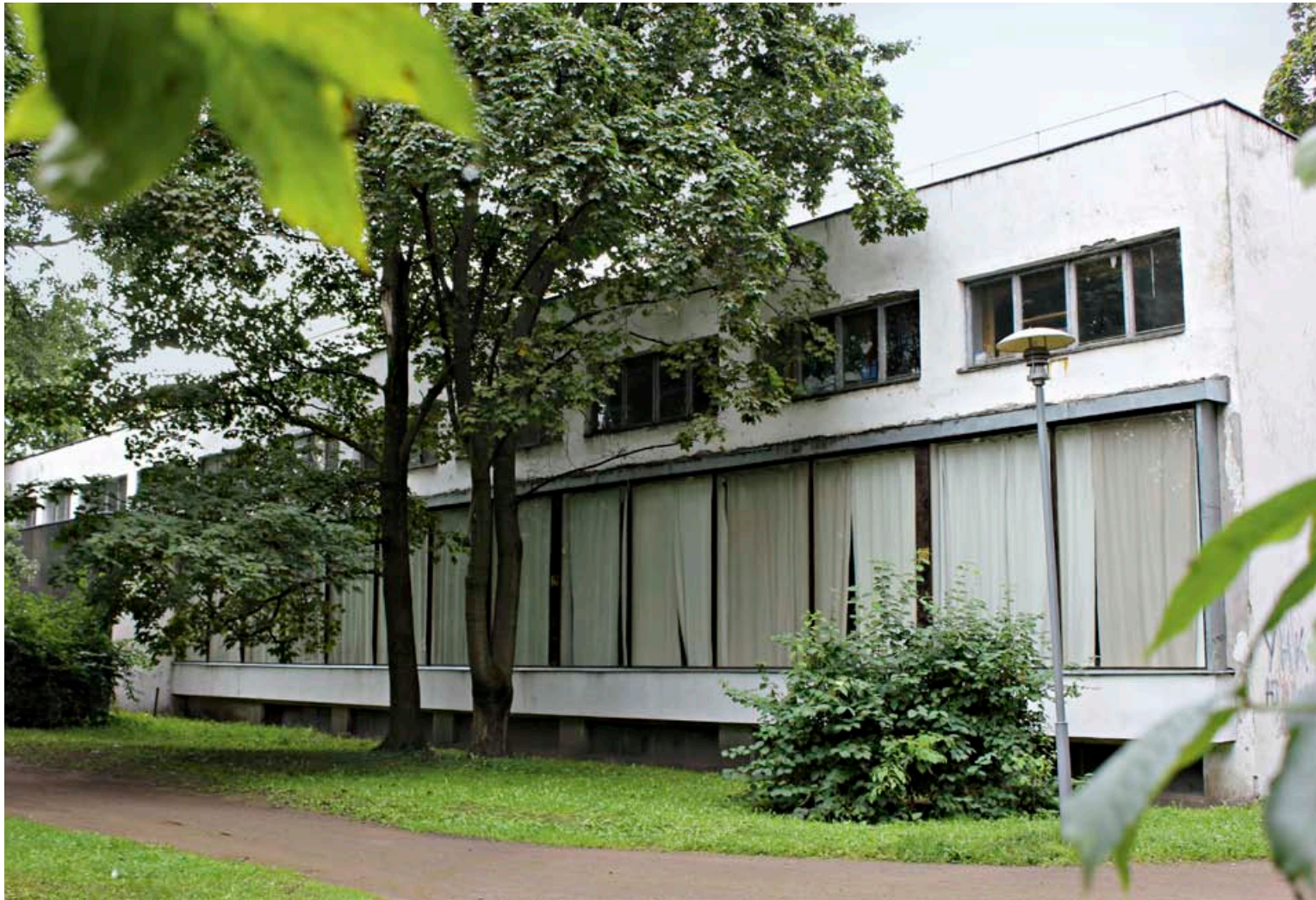
DEFINERENDE VERK: Biblioteket i Vyborg ble bygget i perioden 1933–1935 og regnes for å være en av de første eksemplene på regional modernisme. Alvar Aalto vant oppdraget i konkurranse med flere andre arkitekter i 1927, og foreslo opprinnelig en bygning i tråd med nordisk klassisisme. Etter hvert endret Aalto tegningene i en mer funksjonalistisk og modernistisk stil.

Når utlånssalen nå igjen utfyller sin rolle i den store helheten som er biblioteket, er det i etterkant av et enormt restaureringsarbeid.