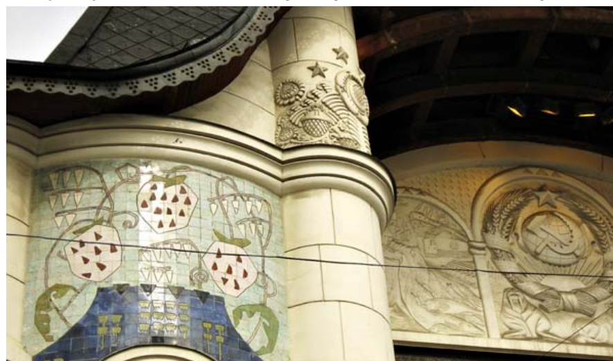
Jaroslavl-banegården, hvor den Transsibiriske Jernbane udgår og ender, blev bygget i art nouveau. Senere satte kommunisterne deres aftryk med stjerner, hammer og segl.