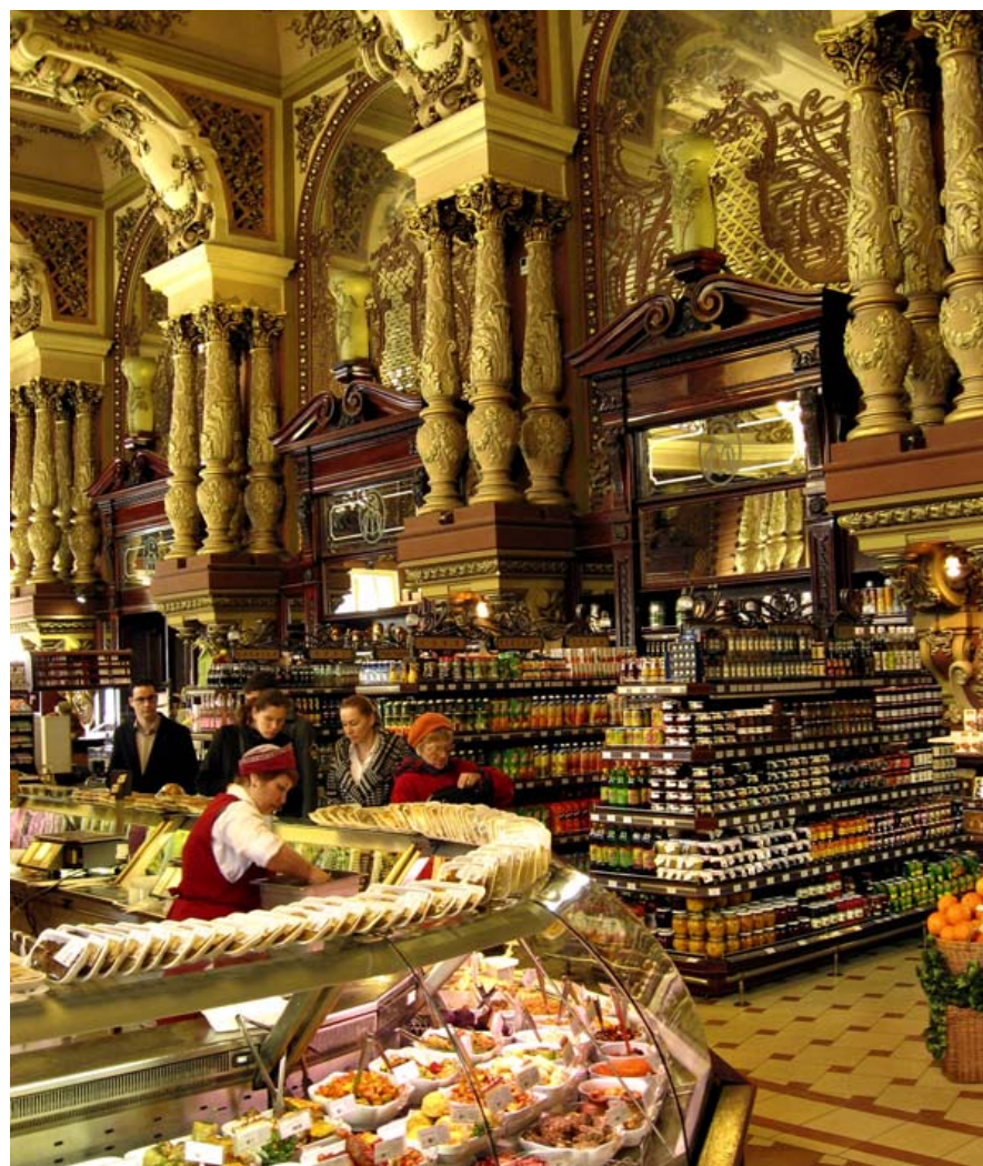
I storslåede omgivelser gør rige moskovitter deres indkøb. Det berømte Jelisejev-supermarkedet åbnede i 1901 og har også en filial i Sankt Petersborg.