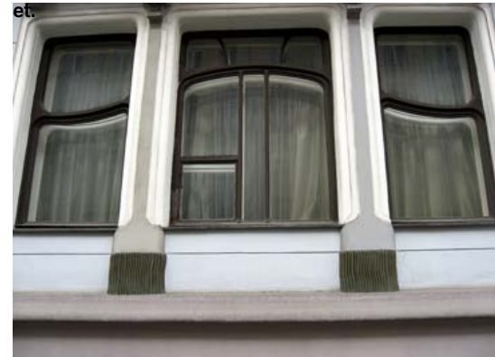
Vinduesrammerne i den newzealandske ambassade med karakteristiske art nouveau-sving.