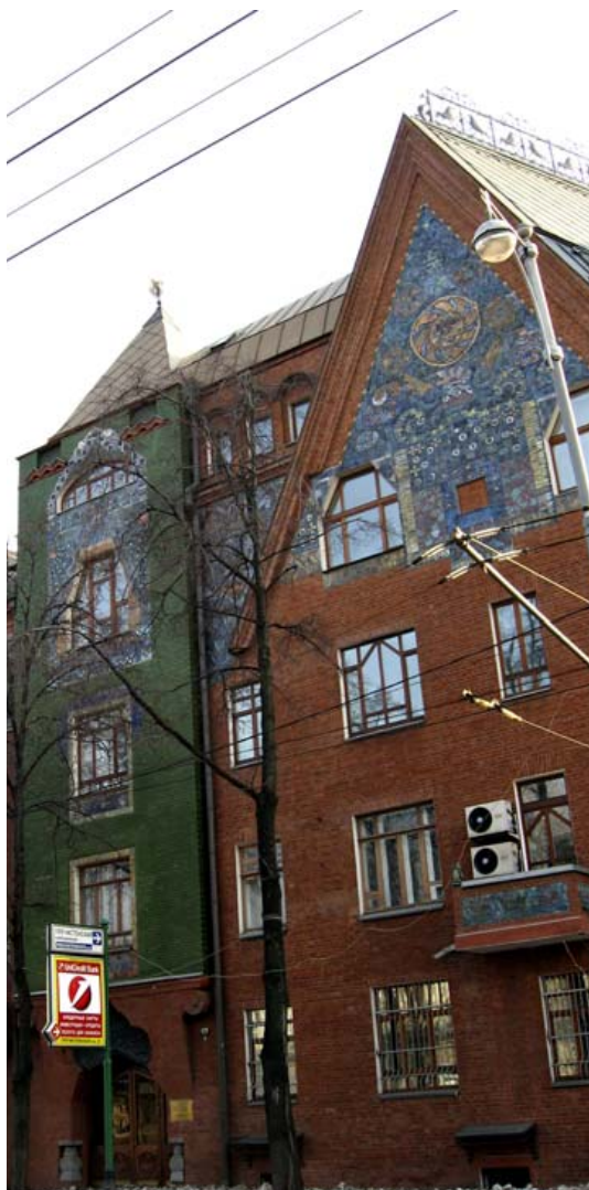
Pertsova-huset skiller sig tydeligt ud i gadebillede. Arkitekt Sergej Maljutin havde mange sjove indfald og vide rammer.

Byggematadorer på kortsigtet profittagt lader indkøbscentre, internationale