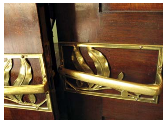
I Rjabusjinskijs villa er alt inventar formgivet til huset.