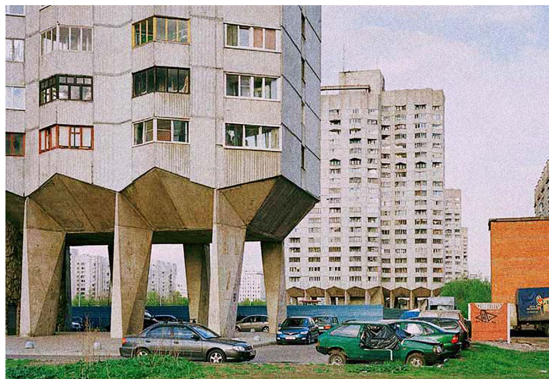
TUSINDEN. Store betondyr med overdimensionerede insektben er på march i Sankt Petersburg, Rusland.