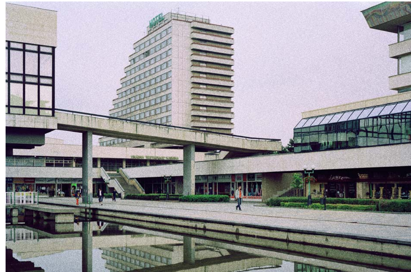
FORSØMT. Rust driver ned ad siden på en fodgængerbro, som fører hen over en socialistisk udgave af et bycenter. Omgivet af beton på alle sider kan man foretage sine indkøb i ro og mag. I baggrunden Hotel Cascade i Most, Tjekkiet.