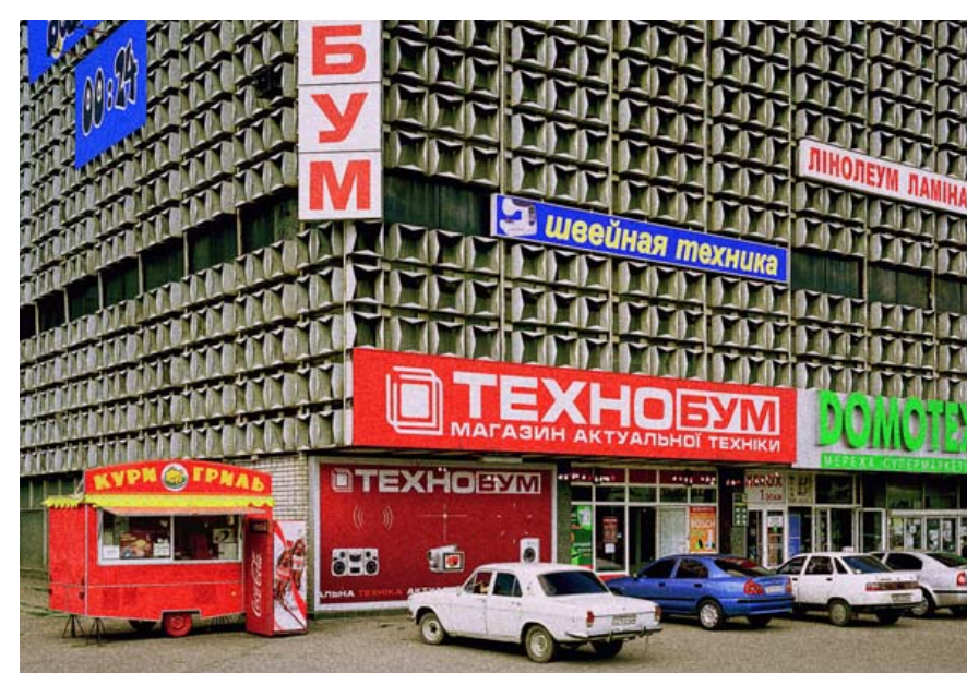
NY IDEOLOGI. Et stormagasin i Dnipropetrovsk, Ukraine, er siden landets overgang til markedsøkonomi blevet overhængt med reklamer.