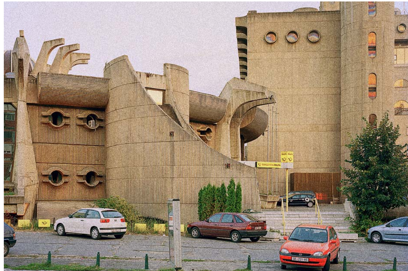
FINSK INSPIRATION. Det centrale posthus i Skopje, Makedonien, er tegnet af Janko Konstantinov. Han arbejdede sammen med Alvar Aalto i Finland, men vendte i 1963 hjem til Skopje for at hjælpe med at genopbygge byen efter et katastrofalt jordskælv.