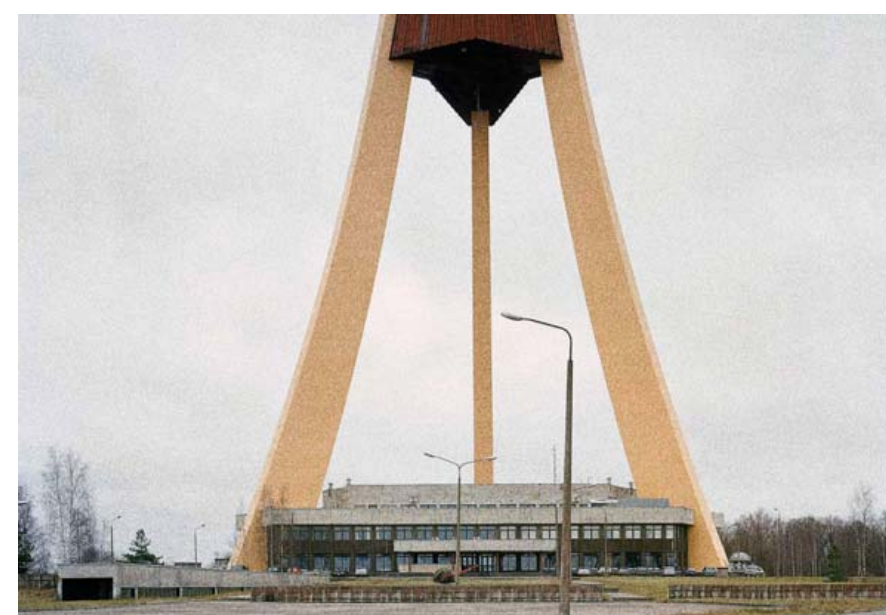
UFO. Radiotårnet i Riga, Letland, ligner marsboere fra H. G. Wells' 'Klodernes Kamp'.