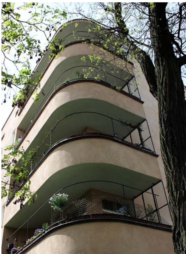
PRENZLAUER BERG. Arkitekten Bruno Taut måtte flygte fra nazisterne, efter han havde opført Wohnstadt Carl Legien.

sker, når den globale multikulturelle elite indtager en ny bydel.